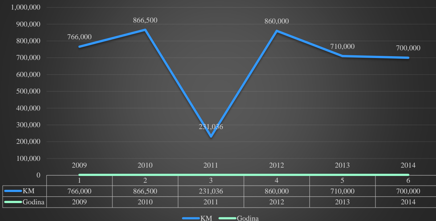
UKUPNA SREDSTVA ZA ZAPOŠLJAVANJE ROMA 2009-2014